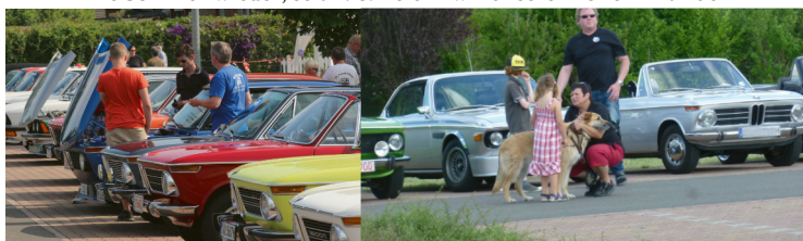
Aus Freude am Fahren: BMW02. Aus Freude an der Freundschaft: 02 Club Rhein Main